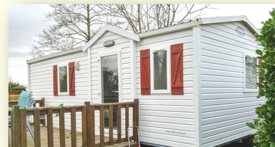
Descriptif de l'hébergement:

Kit d'accueil: papier toilette, sacs poubelle, produits ménagers, kit de bienvenue café/thé.